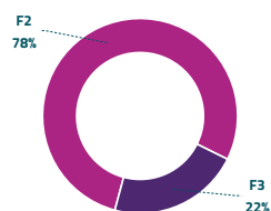
Grafico 2: ripartizione per fascia