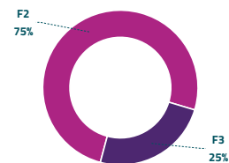
Grafico 2: ripartizione per fascia